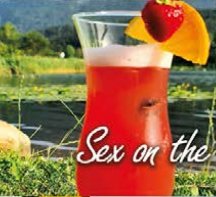
Sex on the Beach